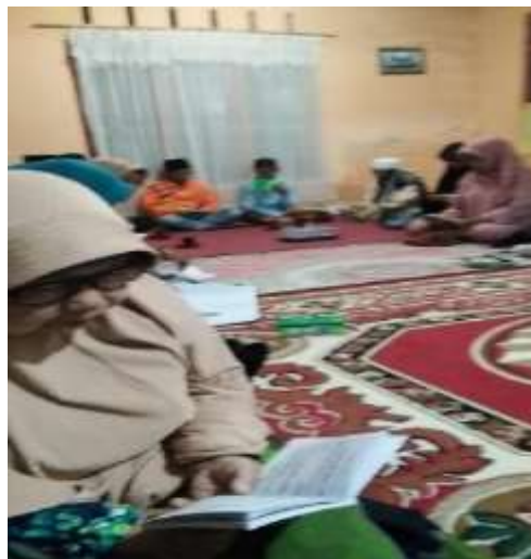
Gambar 1. Proses pelaksanaan kegiatan yasinan

Pelaksanaan kegiatan yasinan dipimpin oleh seorang ustadz yang membimbing para jamaah untuk memastikan bahwa bacaan yang dibaca sesuai dengan urutannya dan sesuai dengan kaidah membaca Al-Qur'an. Ustadz berperan sebagai pemimpin kegiatan yasinan memulai kegiatan dengan mengucapkan salam serta membaca surat Al - fatihah sebanyak satu kali dan diikuti oleh jamaah, setelah membacakan surat Al-fatihah selanjutnya ustadz membimbing membaca surat Yasin dimulai dari ayat 1 sampai 83. Setelah pembacaan surat Yasin, langsung dilanjutkan dengan kegiatan tahlilan. Proses kegiatan tahlilan dimulai dari pembacaan surat Al-Fatihah sebanyak satu kali, Al-Ikhlas sebanyak tiga kali, Al-Falaq sebanyak tiga kali, dan An-Nas sebanyak tiga kali. Dan setelah itu ustadz membimbing tahlil dilakukan secara bersama-sama. Setelah melakukan tahlil secara bersama-sama kegiatan selanjutnya yang dilakukan yaitu membaca do'a dan sebelum pembacaan do'a dilakukan terlebih dahulu membaca surat Al-Fatihah sebanyak satu kali, Al-Baqarah ayat 1 sampai 5, Al-Baqarah ayat 255 dan Al-Baqarah ayat 284-286. dan setelah semua surat dibaca oleh ustadz atau pembimbing kegiatan yasinan maka selanjutnya yang dilakukan adalah membacakan sholawat kepada Rasulullah dengan tujuan do'a yang dibacakan akan cepat diterima oleh Allah SWT karena pembacaan do'a diringi dengan proses tawassul, setelah itu baru membaca do'a dengan tujuan mengirimkan kepada arwah orang yang telah meninggal dan mendo'akan orang yang masih hidup.