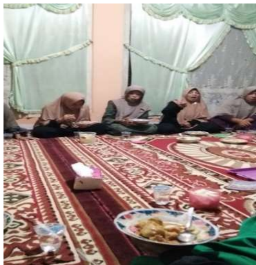
Gambar 3. Kegiatan makan makan dan minum setelah acara yasinan

Setelah kegiatan evaluasi dan ceramah telah selesai dilaksanakan maka kegiatan yasinan telah selesai dan setelah acara yasinan jama'ah yang manjadi tuan rumah atau penyelenggara kegiatan yasinan akan menyuguhkan makanan dan minuman kepada seluruh anggota kegiatan yasinan yang hadir saat acara dilaksanakan dan makanan yang disajikan merupakan hasil iuran dari seluruh anggota yasinan yang mana penyajian makanan dan minuman tidak memberatkan anggota yasinan yang manjadi tuan rumah penyelenggara kegiatan, hal ini sudah manjadi tradisi secara terus-menerus. Tujuan dari kegiatan ini adalah untuk membentuk rasa kekeluargaan dan kebersamaan antar sesama anggota yasinan.