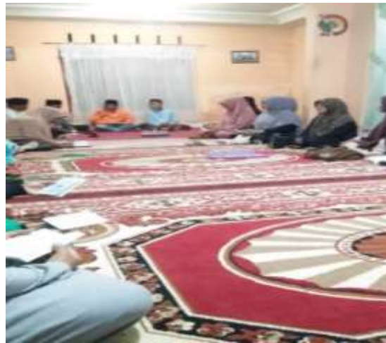
Gambar 2. Evaluasi dan Ceramah setelah kegiatan membaca surat yasin

Setelah kegiatan evaluasi dan ceramah telah selesai dilaksanakan maka kegiatan yasinan telah selesai dan setelah acara yasinan jama'ah yang manjadi tuan rumah atau penyelenggara kegiatan yasinan akan menyuguhkan makanan dan minuman kepada seluruh anggota kegiatan yasinan yang hadir saat acara dilaksanakan dan makanan yang disajikan merupakan hasil iuran dari seluruh anggota yasinan yang mana penyajian makanan dan minuman tidak memberatkan anggota yasinan yang manjadi tuan rumah penyelenggara kegiatan, hal ini sudah manjadi tradisi secara terus-menerus. Tujuan dari kegiatan ini adalah untuk membentuk rasa kekeluargaan dan kebersamaan antar sesama anggota yasinan.