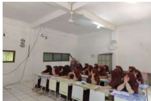
Gambar 3. Pendampingan Siswa dalam Menyelesaikan Tugas Mengenai Literasi Keuangan

Setelah penyampaian materi oleh narasumber, dilakukan diskusi tentang materi yang diberikan dengan peserta. Materi ini merupakan materi yang cukup menarik perhatian peserta sehingga banyak pertanyaan yang disampaikan oleh peserta tentang hal-hal yang belum dipahami terkait materi yang diberikan.