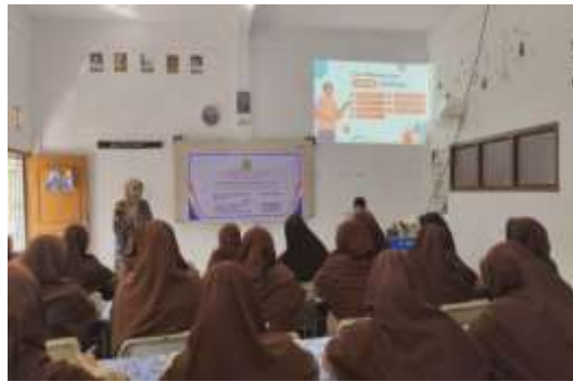
Gambar 2. Penyampaian materi oleh Narasumber

Penyampaian materi dilakukan dengan menggunakan proyektor dan membagikan makalah kepada para peserta agar mereka dapat memahami secara utuh materi yang diberikan. Para peserta cukup antusias menyimak dan memperhatikan bagaimana penjelasan tentang pendidikan literasi pengelolaan keuangan.