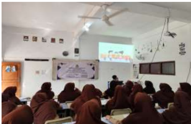
Gambar 3. Latihan Studi Kasus yang Berupa Soal-Soal yang Ditayangkan di Infocus

Pada hari kedua, peserta diberi latihan dan bimbingan untuk menyelesaikan studi yang diberikan. Studi kasus tersebut berupa soal yang harus dipecahkan oleh siswa, tentunya soal yang diberikan relevan untuk siswa SMA yang kemudian dipresentasikan secara berkelompok. Pada hari ketiga, tim melakukan evaluasi atas seluruh kegiatan. Dari hasil evaluasi, terlihat bahwa peserta telah cukup memahami pentingnya pemahaman mengenai pajak PMSE, terutama bagi siswa SMA selaku pengguna platform digital.