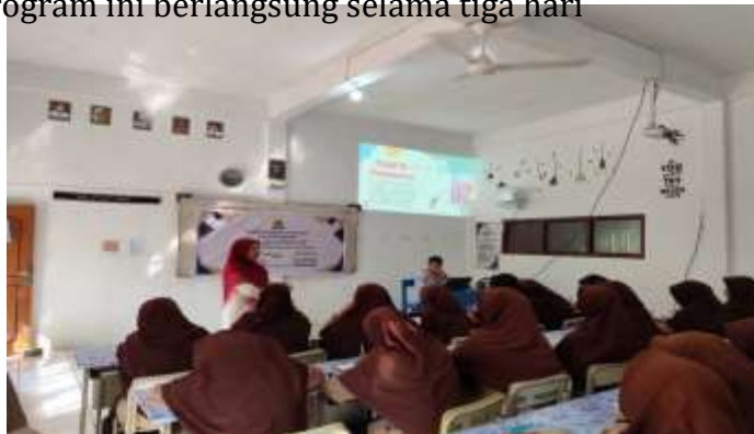
Gambar 1. Penyampaian Materi Mengenai Pajak PMSE

Kegiatan pengabdian mengenai Sosialisasi Pemahaman Pengetahuan tentang Pajak E- Commerce pada Transaksi Online di Pesantren Raudhatul Ulum Saka Tiga, Ogan Ilir, diikuti oleh 40 peserta yang berasal dari siswa SMA Islam Terpadu Pesantren Sakatiga Ol. Program ini dilaksanakan dalam tiga tahap: tahap pengenalan (sosialisasi), tahap penerapan, dan tahap evaluasi. Pada tahap pengenalan, peserta diperkenalkan dengan pentingnya pajak bagi tatanan sebuah negara serta konsep dasar pajak PMSE. Selanjutnya, di tahap penerapan, tim pengabdian membimbing peserta dalam menyelesaikan studi kasus yang berfokus pada peningkatan pemahaman tentang pajak PMSE kepada siswa selaku pengguna media digital. Tahap terakhir adalah evaluasi, di mana pengetahuan dan studi kasus yang diberikan kepada peserta akan dievaluasi. Keseluruhan program ini berlangsung selama tiga hari