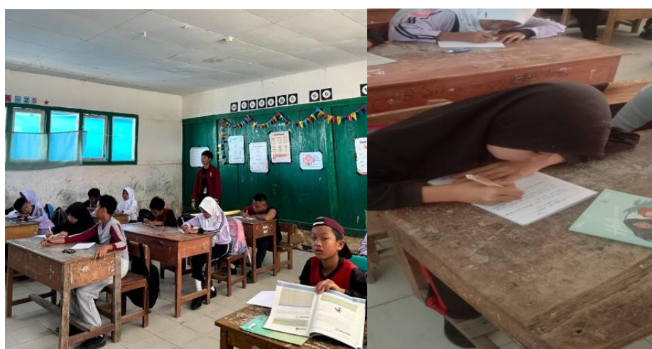
Gambar 4. Mengawasi dan menganalisis unsur intrinsik & ekstrinsik cerpen

Kegiatan yang ditunjukkan dalam Gambar 3 dan Gambar 4 berfokus pada proses pembuatan cerpen oleh siswa dan analisis unsur intrinsik dan ekstrinsik dalam karya tersebut. Setelah siswa menyelesaikan tugas menulis cerpen, mereka diberikan kesempatan untuk menyampaikan hasil kerja mereka. Dalam sesi ini, siswa tidak hanya mempresentasikan cerpen yang telah mereka buat, tetapi juga melakukan analisis terhadap kedua unsur penting yang ada dalam cerpen. Analisis unsur intrinsik mencakup elemen-elemen seperti tema, tokoh, alur, latar, dan gaya bahasa, sementara analisis unsur ekstrinsik melibatkan konteks sosial, budaya, dan psikologis yang memengaruhi karya tersebut. Setelah presentasi, saya memberikan apresiasi kepada siswa atas usaha dan kreativitas mereka, serta memberikan saran konstruktif untuk pengembangan lebih lanjut. Dengan memberikan umpan balik, siswa dapat memahami kekuatan dan area yang perlu diperbaiki dalam tulisan mereka. Kegiatan ditutup dengan ucapan terima kasih dan pamitan, menghargai partisipasi aktif siswa selama proses pembelajaran. Melalui serangkaian kegiatan ini, diharapkan siswa tidak hanya memperoleh pengetahuan tentang sastra dan cerpen, tetapi juga mengembangkan keterampilan analitis dan kemampuan berkomunikasi yang baik.