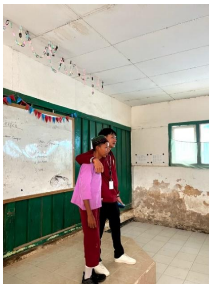
Gambar 5. Siswa menyampaikan hasil kerja

Kegiatan yang ditunjukkan dalam Gambar 5 menyampaikan hasil kerja mereka, yaitu cerpen yang telah ditulis dan dianalisis sebelumnya. Dalam sesi ini, setiap siswa diberikan kesempatan untuk mempresentasikan karya mereka di depan kelas, yang tidak hanya bertujuan untuk berbagi cerita, tetapi juga untuk melatih keterampilan berbicara di depan umum. Siswa menjelaskan tema, alur cerita, serta tokoh-tokoh yang ada dalam cerpen mereka, sambil mengaitkan dengan unsur intrinsik dan ekstrinsik yang telah dibahas sebelumnya. Melalui penyampaian hasil kerja ini, siswa diharapkan dapat memperoleh kepercayaan diri dalam mengungkapkan ide dan gagasan mereka. Selain itu, presentasi ini juga menjadi momen penting untuk menerima umpan balik dari teman sekelas dan saya sebagai pengajar, yang dapat memberikan perspektif baru tentang cara penulisan dan analisis mereka. Kegiatan ini menciptakan suasana belajar yang interaktif, di mana siswa saling belajar dari satu sama lain dan mengapresiasi kreativitas masing-masing. Dengan demikian, kegiatan penyampaian hasil kerja ini merupakan langkah krusial dalam proses pembelajaran, membantu siswa untuk berkembang tidak hanya dalam menulis, tetapi juga dalam kemampuan komunikasi dan analisis kritis.