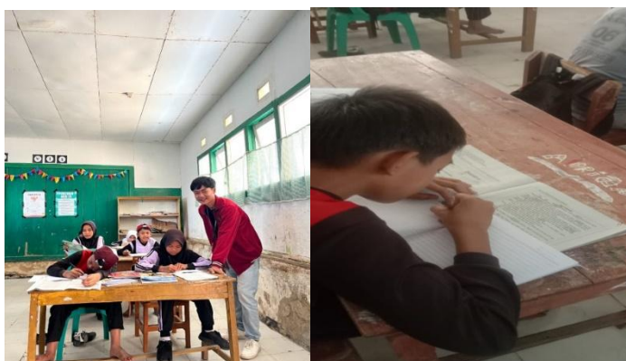
Gambar 3. Siswa mengerjakan tugas membuat cerpen