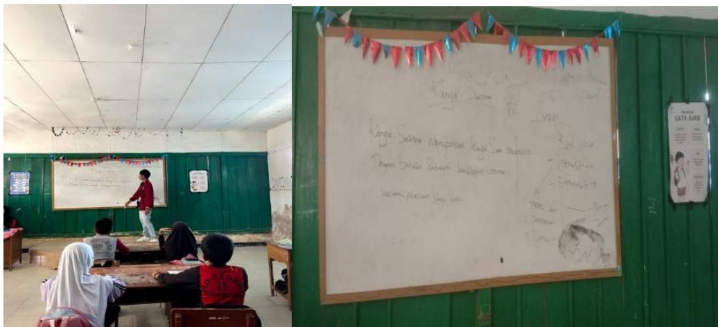
Gambar 2. Menjelaskan ruang lingkup Sastra

Kegiatan observasi kelas dan lingkungan ini dimulai dengan penjelasan umum mengenai sastra, yang mencakup pengertian, jenis-jenis karya, ruang lingkup, ciri-ciri, serta unsur-unsur yang terdapat dalam karya sastra. Peserta diajak untuk memahami bahwa sastra adalah bentuk ekspresi kreatif yang menggunakan bahasa sebagai mediana, meliputi puisi, prosa, dan drama. Penjelasan mengenai berbagai jenis karya sastra ini membantu peserta mengenali karakteristik masing-masing, seperti keindahan bahasa dalam puisi, alur cerita dalam prosa, dan dialog dalam drama. Selain itu, kegiatan ini juga mengedukasi peserta tentang unsur-unsur penting dalam karya sastra, seperti tema, tokoh, alur, latar, sudut pandang, dan gaya bahasa. Selanjutnya, peserta diajak untuk mendalami manfaat dan kegunaan mempelajari sastra, yang dapat meningkatkan kemampuan berbahasa, kreativitas, serta pemahaman terhadap budaya dan nilai-nilai kehidupan. Dengan demikian, kegiatan ini bertujuan untuk membentuk fondasi yang kuat bagi peserta dalam mencintai dan memahami dunia sastra serta mengapresiasi karya-karya sastra yang ada di sekitarnya.