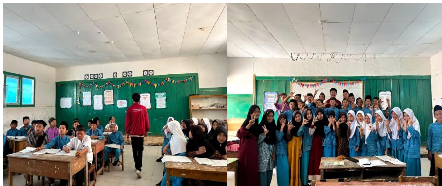
Gambar 1. Observasi kelas dan Lingkungan

Melakukan observasi atau pengamatan dalam lingkungan Sekolah Dasar (SDN 25 Lebong) observasi lingkungan dan observasi kelas. Yang pertama, meminta izin pelaksanaan program kerja kepada kepala sekolah dan guru-guru. Kemudian saya menjabarkan program kerja yang akan saya laksanakan kepada kepala sekolah dan guru kelas VI, agar dapat memberikan izin guna melaksanakan program kerja saya. Setelah mendapatkan izin, selanjutnya saya melakukan observasi langsung di kelas VI, dan mendapatkan temuan bahwasanya di kelas tersebut masih minim sekali pengetahuan tentang sastra. Hal ini semakin membuat saya tergerak untuk lebih semangat dalam menjalankan program tersebut.