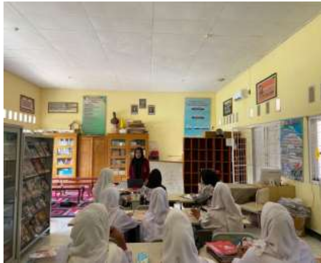
Gambar 1. Menyampaikan Isi Materi Kegiatan.

Meskipun ada banyak keuntungan, ada beberapa masalah saat menerapkannya. Beberapa siswa mengatakan mereka terganggu oleh banyaknya konten yang tidak relevan di media sosial, yang dapat membuat mereka kehilangan fokus pada pelajaran. Selain itu, guru memerlukan pelatihan khusus untuk mengoptimalkan penggunaan teknologi ini karena beberapa masih kurang familiar dengannya.