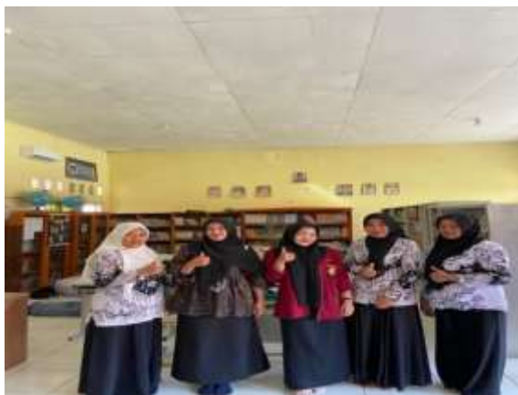
Gambar 3. Foto Bersama Guru SMKN 02 Bengkulu Tengah

edukasi ini dituju kepada siswa kelas 10 dan Guru SMKN 02 Bengkulu Tengah, desa Srikarton. Dengan adanya edukasi ini maka Diharapkan bahwa penggunaan media sosial sebagai alat pembelajaran juga dapat mengurangi dampak negatifnya. Penggunaan media sosial yang meningkat di kalangan siswa sejalan dengan penggunaan berbagai aplikasi tersebut. Sebagian besar siswa menghabiskan empat jam setiap hari untuk berselancar di internet untuk berinteraksi dan memperoleh informasi. Karena intensitas penggunaan media sosial yang tinggi, pendidik dapat memanfaatkannya sebagai media pembelajaran untuk menyampaikan materi dengan cara yang menarik dan sesuai dengan minat siswa mereka. Untuk memanfaatkan media sosial sebagai media pembelajaran, pendidik harus mempersiapkan materi dengan baik.