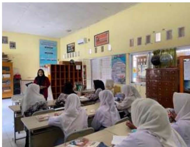
Gambar 2. Sesi Diskusi dan Tanya Jawab

Meskipun ada banyak keuntungan, ada beberapa masalah saat menerapkannya. Beberapa siswa mengatakan mereka terganggu oleh banyaknya konten yang tidak relevan di media sosial, yang dapat membuat mereka kehilangan fokus pada pelajaran. Selain itu, guru memerlukan pelatihan khusus untuk mengoptimalkan penggunaan teknologi ini karena beberapa masih kurang familiar dengannya.