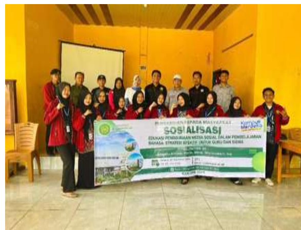
Gambar 3. Foto Bersama Guru SMKN 02 Bengkulu Tengah