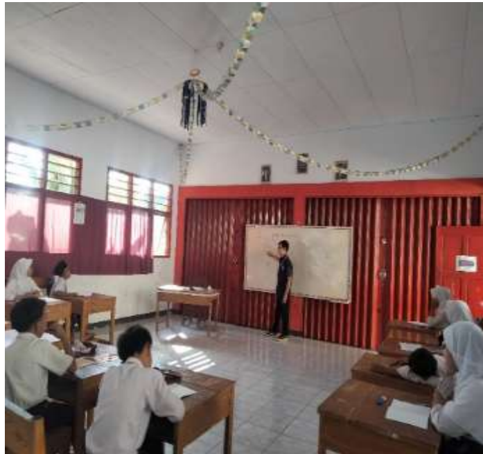
Gambar 2. Kegiatan mengajar di kelas 6 SD Negeri 034 Desa Lubuk Jale