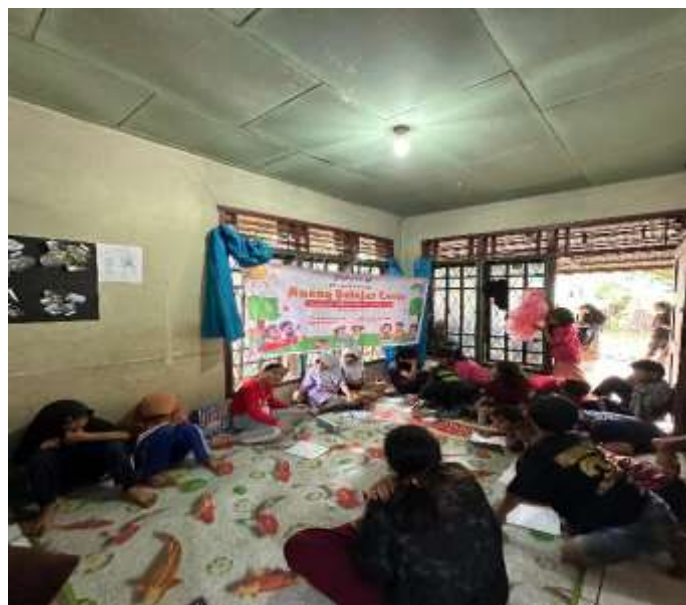
Gambar 3. Kegiatan RBC di Sekretariat Kelompok 91 Desa Lubuk Jale Sumber : Data Pengabdian 2024

Numbers, dan Introduction. Diharapkan melalui pembelajaran ruang belajar cerita ini dapat menambah wawasan pengetahuan, sikap dan keterampilan anak-anak Desa Lubuk Jale. Berdasarkan hasil pengamatan yang dilakukan pada pertemuan minggu pertama di Sekretariat KKNT ditemukan kesulitan anak-anak dalam belajar Bahasa Inggris. Yaitu kesulitan dalam pengucapan dan penulisan yang belum tepat. Hal ini dikarenakan aksen bahasa daerah mereka yang masih kental. Sedangkan untuk kegiatan mengajar di sekolah, kurangnya kefokusannya dan cepatnya anak-anak merasa bosan dalam pembelajaran merupakan masalah yang paling krusial. Dengan permasalahan di atas, akan lebih baik jika melakukan kegiatan pembelajaran di sekolah dengan sarana dan prasarana yang mendukung. Ditambah dengan cara pembelajaran yang bervariasi dan menyenangkan bagi anak-anak. Jika ingin membuka bimbingan belajar untuk anak-anak memerlukan sarana yang lengkap.