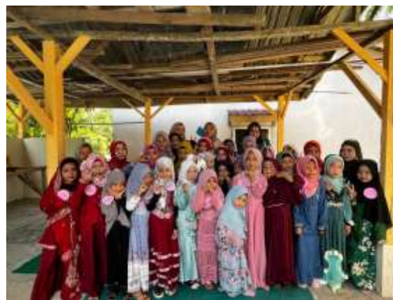
Gambar 2.1 kegiatan festival anak Sholeh