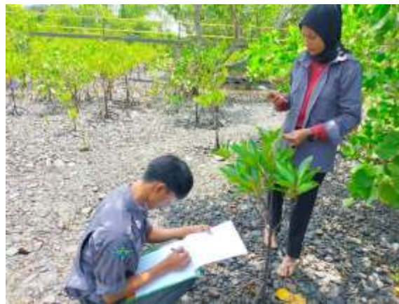
Gambar 4. Pemantauan Pertumbuhan Mangrove

Penanaman Rhizophora mucronata menunjukkan hasil yang lebih baik dibandingkan dengan Avicennia marina di area yang lebih terlindung dari ombak besar. Pertumbuhan rata-rata Rhizophora mucronata mencapai 35 cm dalam enam bulan pertama, sedangkan Avicennia marina rata-rata tumbuh 28 cm. Perbedaan ini mungkin disebabkan oleh kemampuan Rhizophora mucronata untuk beradaptasi lebih cepat dengan lingkungan pesisir yang lebih dinamis.