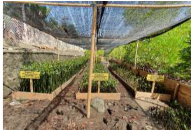
Gambar 2. Pembibitan Tanaman Mangrove

seperti abrasi pantai (Bayraktarov et al., 2020; Bera & Maiti, 2022). Kondisi ini mengakibatkan hilangnya vegetasi mangrove yang berfungsi penting dalam melindungi pantai dari erosi dan menyediakan habitat bagi berbagai spesies laut (Akanni et al., 2018; Alongi, 2020).