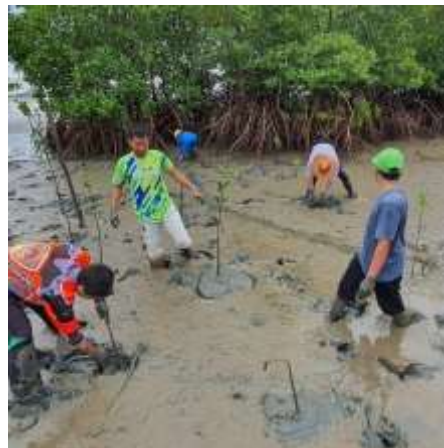
Gambar 3. Penanaman Tanaman Mangrove

Langkah awal dalam kegiatan penanaman adalah pemetaan area pesisir yang paling membutuhkan rehabilitasi. Tim pengabdian bekerja sama dengan masyarakat setempat untuk menentukan lokasi penanaman yang tepat, berdasarkan tingkat kerusakan ekosistem dan potensi keberhasilan rehabilitasi. Setelah lokasi dipilih, dilakukan pembersihan lahan untuk menghilangkan sampah, tanaman invasif, dan puing-puing yang dapat menghambat pertumbuhan bibit mangrove.