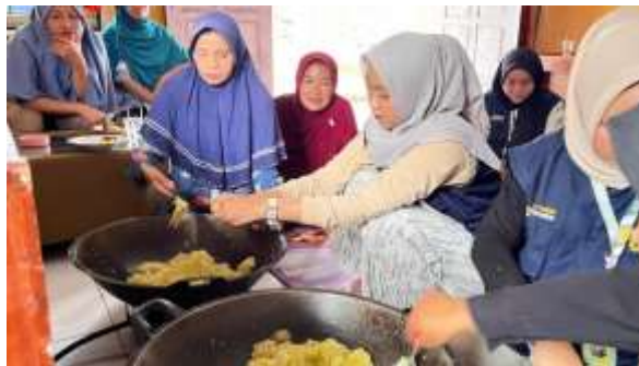
Gambar 4. Menambahkan gula dalam wajan

Pada tahap selanjutnya, siapkan wajan bersih, lalu masukkan pepaya yang sudah diperas tadi kedalam wajan. Tambahkan gula kedalam wajan dengan perbandingan 1:1 dengan pepaya muda. Tahap ini dapat dilihat pada gambar.