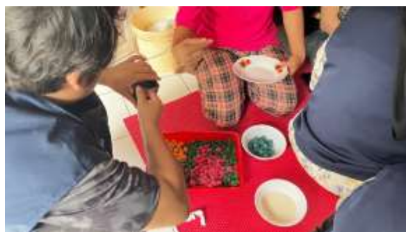
Gambar 6. Memasukkan manisan ke dalam kemasan

Letakkan adonan manisan pepaya yang sudah jadi di atas nampan dan diamkan pada suhu ruang. Keringkan manisan dengan sedikit memberikan angin tanpa menjemur manisan di bawah sinar matahari. Setelah kering, manisan pepaya siap untuk dikonsumsi. Apabila ingin disimpan atau dijual, manisan pepaya dapat disimpan dalam kemasan kedap udara untuk menjaga kesegarannya. Tahap ini dapat dilihat pada gambar.