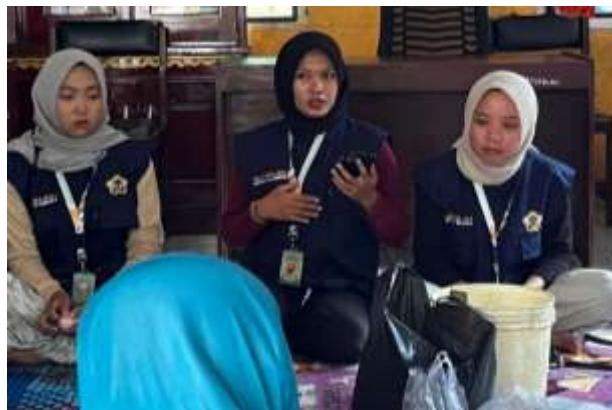
Gambar 1. Penyampaian materi tahapan pembuatan manisan pepaya

Kegiatan pelatihan teknik pengolahan Manisan Pepaya Muda di Desa Aur Gading, Kabupaten Bengkulu Utara, Provinsi Bengkulu melibatkan kolaborasi antara mahasiswa Kuliah Kerja Nyata Tematik Universitas Bengkulu (KKNT UNIB) dengan 20 ibu-ibu PKK Desa Aur Gading. Secara teknis, metode yang digunakan pada kegiatan pengabdian ini adalah metode ceramah dan simulasi. Metode ceramah digunakan untuk memberikan pemahaman tentang langkah-langkah cara pembuatan manisan pepaya dan diakiri dengan sesi diskusi. Dilanjutkan dengan memberikan metode simulasi untuk menunjukkan bagaimana cara pembuatan manisan pepaya muda yang benar secara langsung. Sebelum kegiatan berlangsung, mahasiswa KKNT UNIB terlebih dahulu menyiapkan alat dan bahan yang diperlukan untuk pembuatan manisan. Alat yang digunakan antara lain parutan kelapa; kuai; sendok goreng; kompor gas; pisau; kain bersih dan kemasan. Untuk bahan yang digunakan yaitu buah pepaya muda 5 kg; gula 5 kg; jeruk nipis dan 5 pewarna makanan.