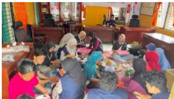
Gambar 5. Proses pembuatan bulatan manisa pepaya

Letakkan adonan manisan pepaya yang sudah jadi di atas nampan dan diamkan pada suhu ruang. Keringkan manisan dengan sedikit memberikan angin tanpa menjemur manisan di bawah sinar matahari. Setelah kering, manisan pepaya siap untuk dikonsumsi. Apabila ingin disimpan atau dijual, manisan pepaya dapat disimpan dalam kemasan kedap udara untuk menjaga kesegarannya. Tahap ini dapat dilihat pada gambar.