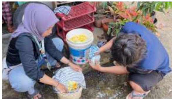
Gambar 3. Tahap pemerasan pepaya

Pada tahap selanjutnya, siapkan wajan bersih, lalu masukkan pepaya yang sudah diperas tadi kedalam wajan. Tambahkan gula kedalam wajan dengan perbandingan 1:1 dengan pepaya muda. Tahap ini dapat dilihat pada gambar.