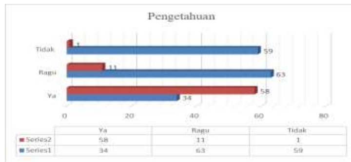
Tabel 1. Tingkat pengetahuan peserta pelatihan sebelum Free Test dan Post test

hingga akhir acara, dan dilanjutkan dengan adanya diskusi tanya jawab antara peserta dan narasumber.