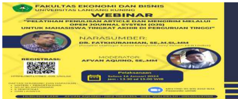
Gambar 3. Flyer Pelaksanaan pelatihan penulisan article dan submit Ojs

fakultas ekonomi dan bisnis Universitas Lancang Kuning, tim dosen dalam hal ini dapat merealisasikan salah satu fungsi dari tri dharma perguruan tinggi yakni pengabdian masyarakat. Adapun dapat terlaksananya dengan baik dan lancar tidak lepas problem yang datang dari mahasiswa yang menghadapi kendala pasca tugas akhir untuk membuat karya tulis ilmiah, kendala ini tidak datang dari sebahagian kecil mahasiswa namun hampir sebahagian besar menjadi kendala bagi mahasiswa. Sasaran dari pelaksanaan pengabdian ini yakni mahasiswa tingkat akhir, baik S1, S2 dan S3, ini bisa dilihat peserta yang mendaftar dan hadir dalam pelaksanaan webinar ini.