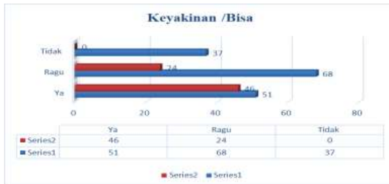
Tabel 3. Tingkat keyakinan/bisa peserta pelatihan sebelum Free Test dan Post test

Dari sebaran kuesioner, ditambah dengan diskusi dua arah yang baik serta narasumber active memberikan arahan setelah pemaparan materi, didapatkan data dimana peserta pelatihan yang masih awan/ tidak mengenal karya tulis dengan baik, semakin mengenal juga familiar akan article, yang masih ragu tingkat keraguannya semakin berkurang dan yang tidak yakin bisa menulis karya tulis ilmiah (article) semakin yakin/bisa membuatnya dengan lebih baik. Dengan terjadinya peningkatan pengetahuan, pemahaman peserta pelatihan artinya disini dapat kita tarik hasilnya yang menyatakan bahwa pelatihan ini memberikan kontribusi positive akan dari pelaksanaan pelatihan ini. Dengan adanya kontribusi ini, tentunya akan memberikan kemamfaatan yang lebih luas, sehingga mahasiswa yang menjadi target dari pelaksanaan pengabdian ini merasakan peningkatan pengetahuan dan pemahaman, semakin mengenal dengan baik akan karya tulis ilmiah/article dan open journal system (OJS) sehingga tidak mengalami kesulitan berarti akan tugas akhir mereka. Dari pelaksanaan pelatihan ini membuktikan bahwasannya pelatihan ini juga sejalan dengan apa yang telah dilakukan Hasanah et al., (2020); Ritonga et al., (2022) dimana dengan pelatihan akan penulisan karya tulis ilmiah dapat meningkatkan pengetahuan dan pemahaman dari peserta akan penulisan karya tulis dan submit ke jurnal yang di tuju.