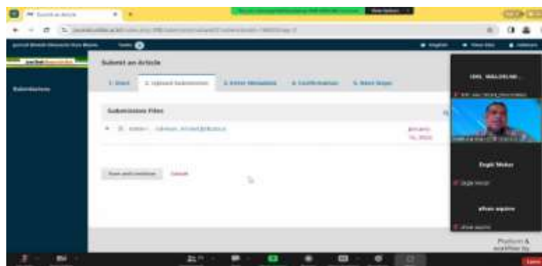
Gambar 2. Pemaparan materi oleh Narasumber oleh Dr. Fatkhurahman

Dalam penelitian juga sangat dibutuhkan kesimpulan dan saran, dimana kesimpulan dan saran ini muncul dari penelitian yang dilakukan, dan menjawab permasalahan yang belum terjawab, serta apa perlu di perbaiki atau revisi, dalam hal ini perlu di perhatikan yakni sebagai berikut ; (1) Bukan “copas” dari pembahasan, (2) Pernyataan pendek atau generalisasi dari temuan, (3) Memuat jawaban atas pertanyaan penelitian, (4) Berupa deskriptif, bukan numerik, (5) Memuat implikasi temuan penelitian, saran yang bersifat praktis, pengembangan teori, dan arah penelitian lanjutan, (6) Harus lengkap sesuai rujukan dalam teks, (6) Tata cara penulisan mengacu pada aturan jurnal yang bersangkutan.