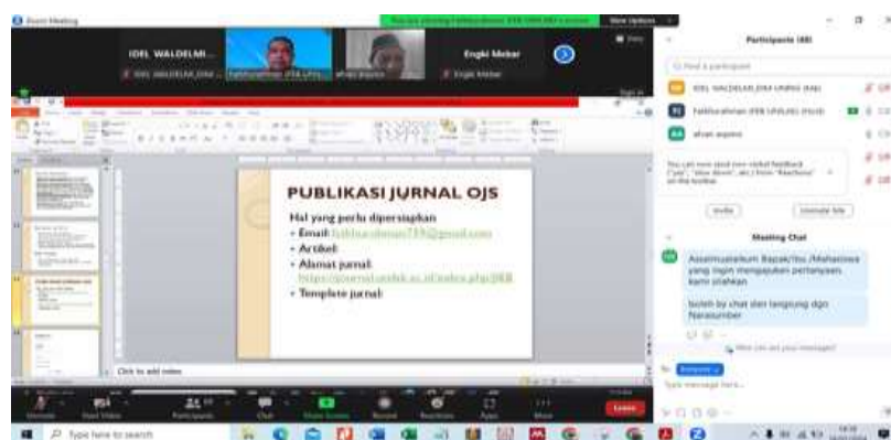
Gambar 4. Pemaparan materi oleh narasumber pelatihan

Pelaksanaan dari pengabdian ini dilaksanakan pada hari Selasa 16 Januari 2024, Jam 13.30 sd 15.00. Adapun dalam pelaksanaan pengabdian ini alhamdulillah dihadiri dari berbagai tingkat Pendidikan (S1, S2 dan S3) dan pengiat penelitian lainnya. Dalam pelaksanaan pengabdian ini mengangkat tema : pelatihan penulisan article dan mengirim melalui open jurnal system (OJS) untuk mahasiswa tingkat akhir. Adapun pemateri yang dihadirkan dalam kesempatan ini yakni dosen fakultas ekonomi dan bisnis universitas lancang kuning, Dr. Fatkhurahman, SE.,M.Si, MM yang sudah cukup lama bergelut dengan berbagai jurnal dan sekaligus pengelola jurnal kompetif.com.