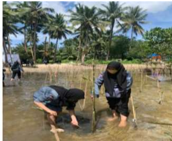
Gambar 5. Foto penanaman bibit mangrove oleh mahasiswa

Penanaman kembali di kawasan hutan mangrove di wilayah pesisir pantai Bungku Toko Kota Kendari ini dilakukan sebagai bentuk kegiatan pengabdian kepada masyarakat pada daerah pesisir pantai. Kegiatan ini juga merupakan wujud kepedulian pihak perguruan tinggi terhadap lingkungan. Universitas Halu Oleo merupakan Universitas negeri terbesar di Provinsi Sulawesi Tenggara dengan visi menjadi perguruan tinggi kelas dunia dalam pengelolaan dan pengembangan wilayah pesisir, kelautan dan perdesaan pada tahun 2045. Oleh karena itu kegiatan pengabdian ini juga didukung penuh oleh pihak universitas khususnya oleh LPPM dan FKM (Universitas Halu Oleo, 2020).