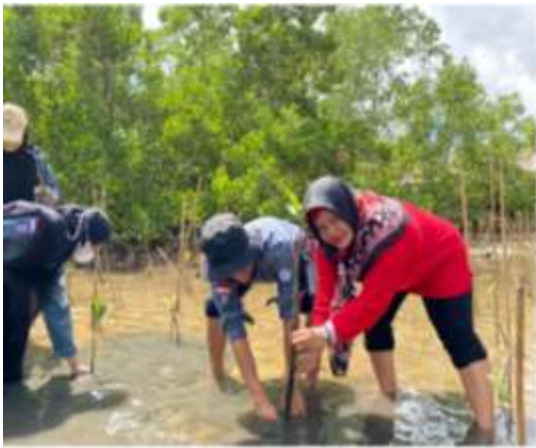
Gambar 4. Proses penanaman bibit mangrove oleh dosen didampingi mahasiswa