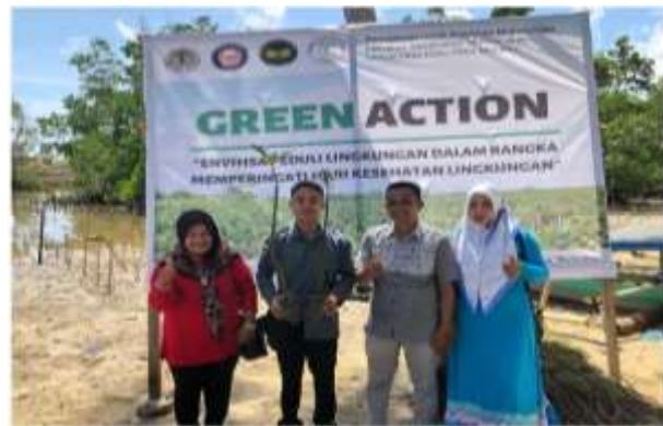
Gambar 3. Foto bersama unsur dosen, mahasiswa, pihak kelurahan dan masyarakat sesaat sebelum memulai penanaman pohon