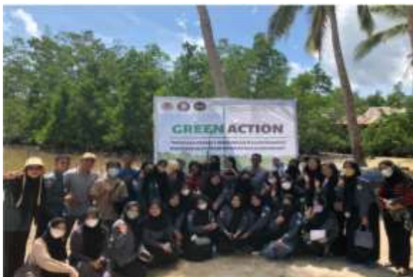
Gambar 2. Foto sesaat bersama sebelum memulai proses edukasi tentang teknik penanaman mangrove

Kegiatan konservasi atau penanaman mangrove ini berlangsung kurang lebih selama 2 jam. Lebih cepat dari waktu yang direncanakan, para peserta juga bekerja lebih cepat karena memperhitungkan jadwal pasang surut air. Dan jumlah peserta cukup banyak yaitu 40 orang yang langsung ikut melakukan penanaman. Jumlah ini mempercepat proses penanaman (Badan Restorasi Gambut dan Mangrove, 2022). Beberapa dokumentasi dalam kegiatan konservasi atau penanaman pohon mangrove ini dapat dilihat pada gambar berikut ini: