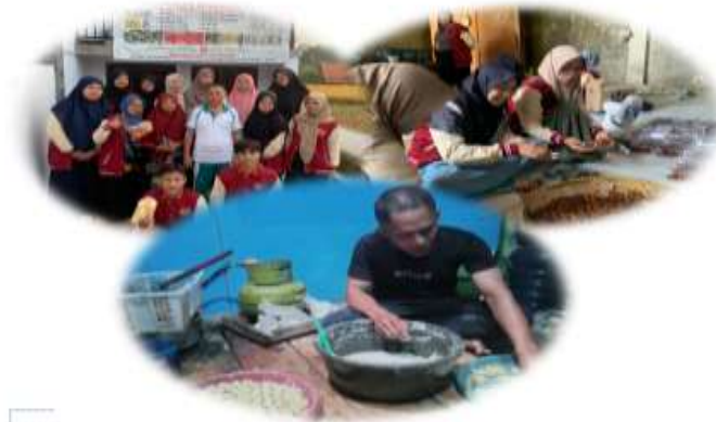
Gambar. 1 Proses Pendampin

Penguatan jiwa kewirausahaan dan kemampuan berinovasi di kalangan pelaku usaha lokal. Pengembangan kemampuan diversifikasi produk untuk meningkatkan nilai tambah.