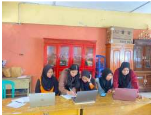
Gambar 1. Pelatihan Penyusunan Buku Kas Menggunakan Microsoft Excel Bagi Bendahara Kelas 1 di SMP negeri 12 Kota Bengkulu

Microsoft Excel, sebagai program aplikasi lembar kerja yang dikembangkan dan didistribusikan oleh Microsoft Office, merupakan alat yang sangat berguna dalam proses ini. Excel menyediakan berbagai fitur dan fungsi yang memudahkan pengguna dalam mengorganisir, menganalisis, dan menyajikan data keuangan (Aulia et al., 2024) Aulia. Dengan menggunakan Excel, bendahara kelas dapat dengan mudah membuat dan mengelola buku kas, menyusun laporan keuangan, serta melakukan perhitungan yang diperlukan dengan akurat. Selama pelatihan, peserta diberi pemahaman mendalam mengenai cara menggunakan berbagai fitur Excel yang relevan, seperti formula, grafik, dan tabel pivot. Mereka juga diperkenalkan pada teknik penyusunan laporan yang efektif, yang membantu dalam memantau dan melaporkan status keuangan kelas secara jelas dan sistematis. Hasilnya, para bendahara kelas mampu menerapkan keterampilan yang diperoleh dalam praktik sehari-hari mereka. Keberhasilan pelatihan ini dapat dilihat dari peningkatan kemampuan peserta dalam menyusun dan mengelola buku kas mereka. Mereka menunjukkan pemahaman yang baik tentang bagaimana mencatat transaksi keuangan, menghitung saldo, dan menghasilkan laporan keuangan yang akurat. Ini tidak hanya meningkatkan efisiensi dalam pengelolaan keuangan kelas, tetapi juga memberikan dasar yang kuat bagi transparansi dan akuntabilitas.