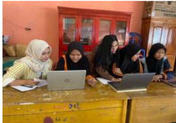
Gambar 2. Pelatihan Penyusunan Buku Kas Menggunakan Microsoft Excel

Kegiatan pelatihan ini dilakukan guna meningkatnya pengetahuan siswa dalam pengelolaan buku kas dengan menggunakan Microsoft Excel. Kegiatan ini diikuti oleh bendahara kelas 8A,8B,8C, 8D dan 8E di SMPN 12 Kota Bengkulu pada Jumat, 17 Mei 2024. Penggunaan keuangan menggunakan Microsoft Excel akan jauh lebih cepat dan memberikan kemudahan serta keakuratan. Metode yang digunakan dalam pelatihan ini yaitu : identifikasi, pelaksanaan dan evaluasi.